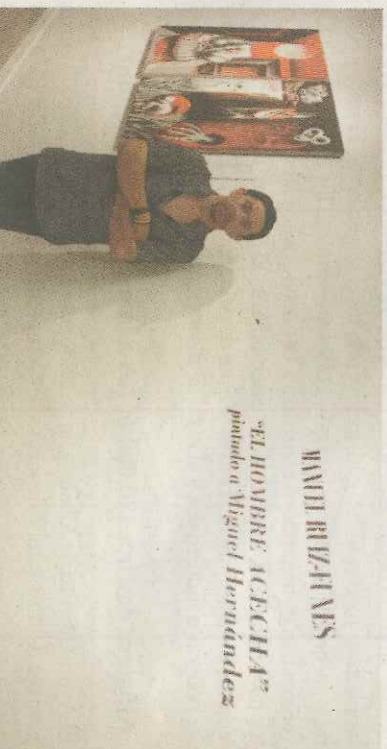
Ruiz-Fuñes ilustra 'El hombre acecha' de Miguel Hernández'.

El catálogo de la muestra cuenta con el prólogo de Jesucristo